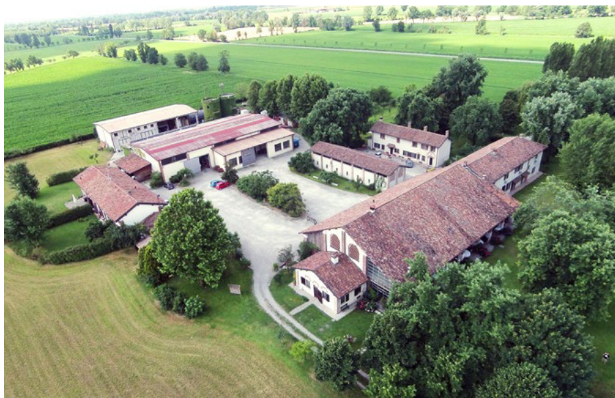
Una veduta aerea dell'agriturismo della famiglia Pirola

L'intervento, partito nel 2019, consiste nella sostituzione di sei generatori termici a servizio del riscaldamento e della produzione di acqua calda per i locali dell'azienda agricola. Al posto dei sei