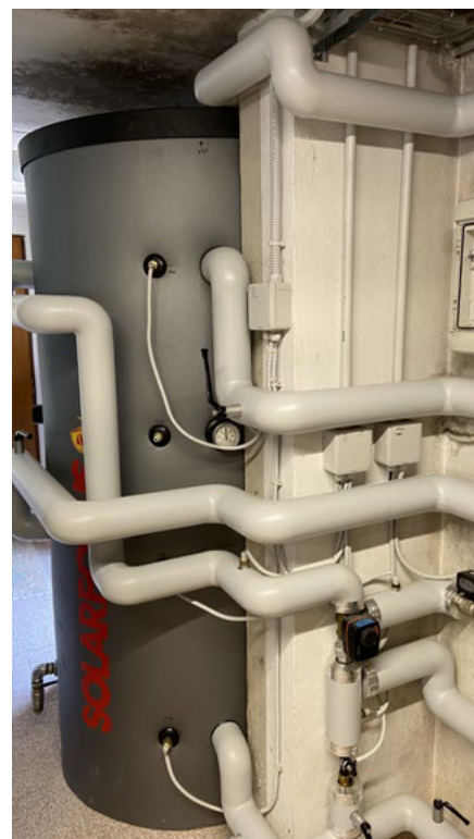
Sottostazione uffici e lavanderia: puffer di alimentazione dell'impianto di riscaldamento e produzione acqua calda sanitaria

Considerando quindi sia i costi di esercizio e manutenzione che quelli per il combustibile, nel passaggio dal vecchio al nuovo impianto i costi annui vengono ridotti di circa il 70% a fronte di benefici legati a una maggiore efficienza, qualità e comfort dell'impianto complessivo. Se a ciò si aggiunge che, pur considerando una vita tecnica di soli 15 anni, in 6 si rientra dall'investimento e nei 9 successivi si matura un valore quasi pari all'entità dell'investimento, si comprendono i motivi che hanno portato i titolari dell'azienda agricola a ritenersi pienamente soddisfatti dell'investimento fatto. ●